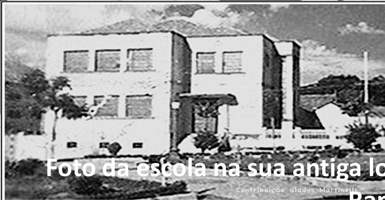
Foto da escola na sua antiga localidade – Praça Doutor Horácio Ramalho