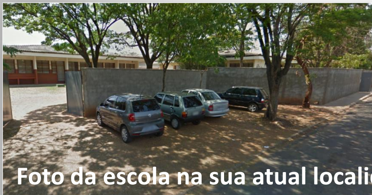
Foto da escola na sua atual localidade - Jardim Residencial Ipiranga